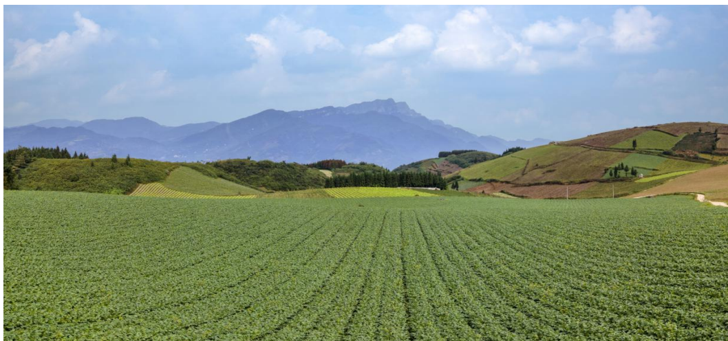
峨眉山市高山蔬菜种植核心区

针对今年罕见的极端高温干旱天气，为保障和丰富市民“菜篮子”，乐山市立足市场，突出优势，差异发展，以破解行业产销分离为切入点，依托峨眉山市高山蔬菜核心区辐射带动峨边县、金口河区、沙湾区、沐川县等地大力发展高山蔬菜产业，带动高山蔬菜核心产区农户人均增收1.5万元。