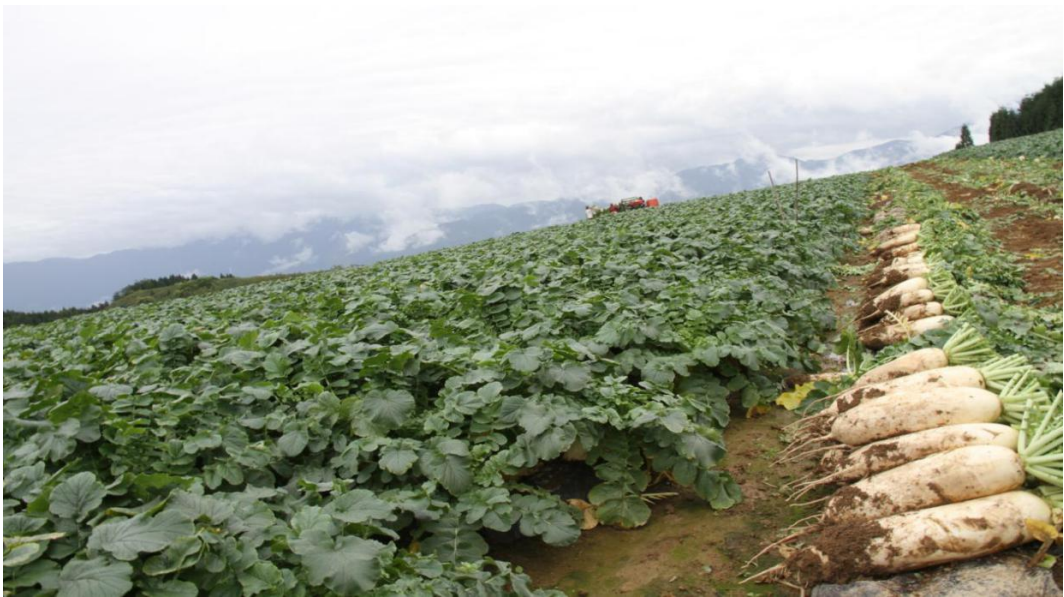
峨眉山市龙池镇高山蔬菜收获中

“保育苗”优结构。 针对高山气候区自然条件，全面推广蔬菜集约化育苗，建成规模以上集中育苗场3个，成活率提升至96%。整合项目资金120万元，因地制宜引进推广中椒5号、川绿11号黄瓜、寒将军等优质良种41个，良种应用全覆盖，形成集大路菜和特色精细菜于一体的多元品种结构。