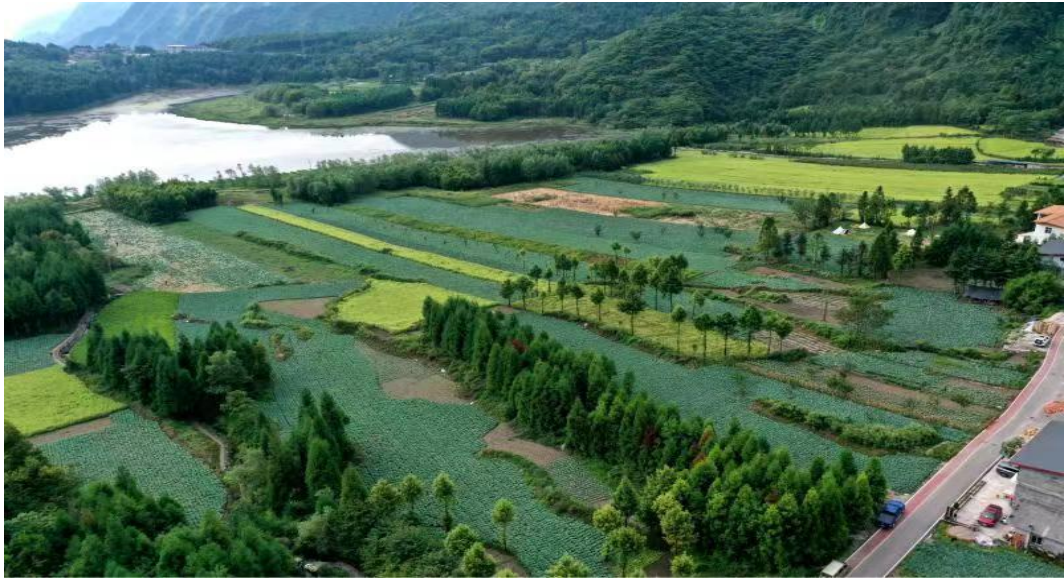
金口河区永胜乡蔬菜基地

一商标进行品牌化销售。全市已在成都、重庆、西安等大中城市建有蔬菜批发网点 23 个，与盒马生鲜、永辉超市等大型连锁商超签订蔬菜直供协议，每年提供精包装蔬菜 300 万份以上，外销率实现 82%，利润高于普通蔬菜 25%-35%，带动农户稳定增收。