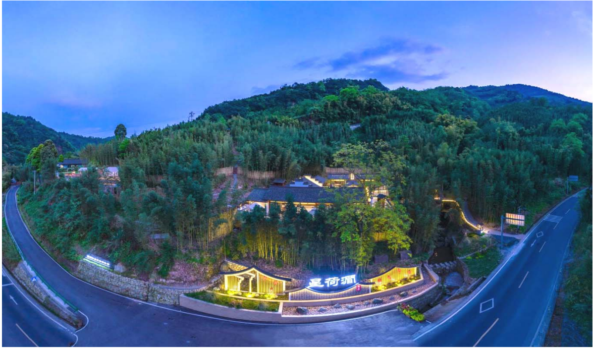
（星荷涧民宿集群夜景）